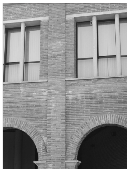
12 febrer 2011