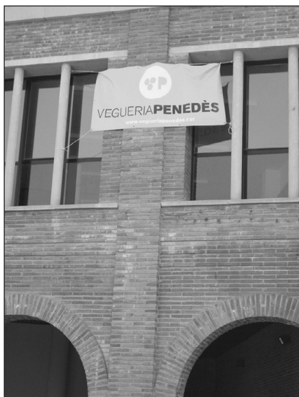
9 agost 2006